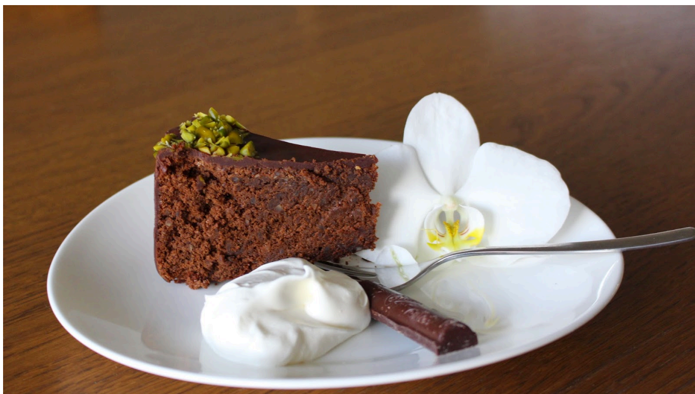
Bester Kuchen Ohne Mehl